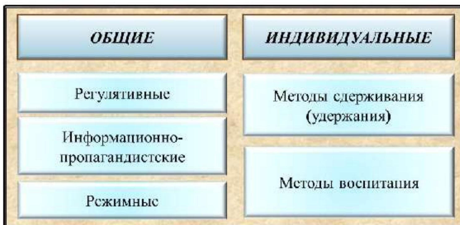
Рис. 12. Методы профилактики терроризма

Методы общей профилактики рассчитаны на оказание предупредительного воздействия на неопределенное множество лиц, на население и его отдельные группы. К данной группе методов относятся: