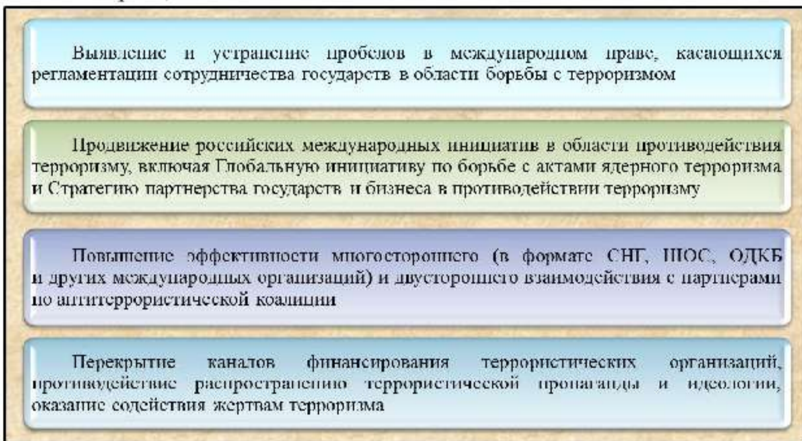
Рис. 11. Основные направления международного сотрудничества в сфере противодействия терроризму

Различают международный, межгосударственный, региональный и межведомственный уровни антитеррористического сотрудничества. Каждому из них соответствует определенный перечень нормативных правовых актов, своя специфика, задачи и методы.