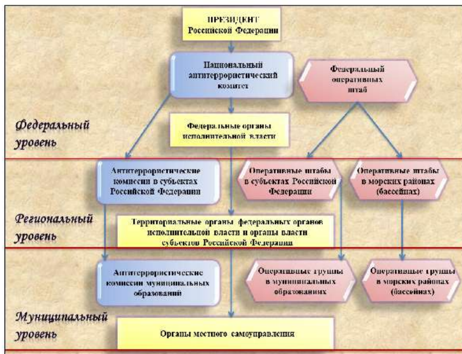
Рис. 6. Структура общегосударственной системы противодействия терроризму

осуществляют иные полномочия по решению вопросов местного значения по участию в профилактике терроризма, а также в минимизации и (или) ликвидации последствий его проявлений 1 (рис. 6).