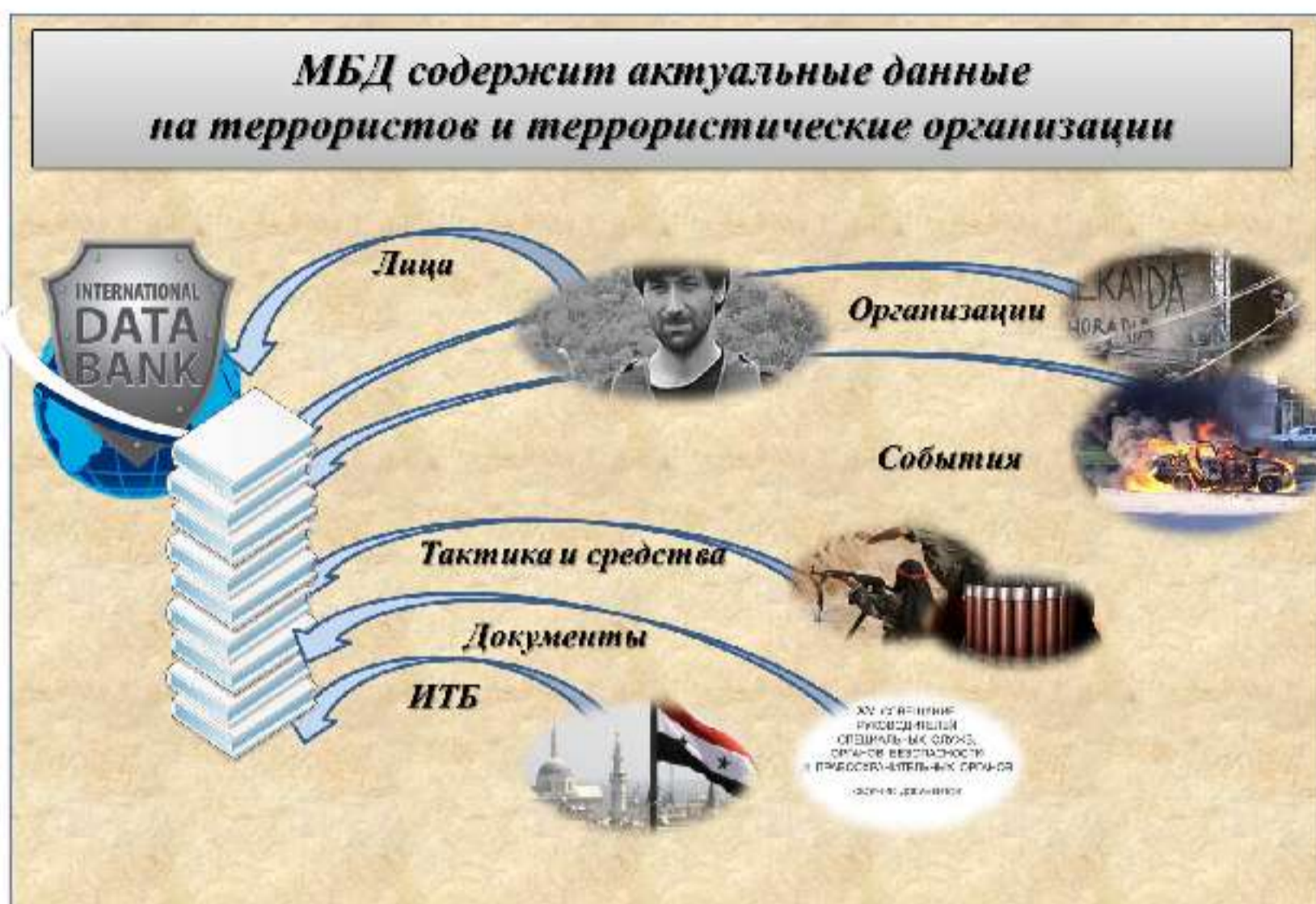
Рис. 10. Структура Международного банка данных по противодействию терроризму

удобном для пользователя виде, в том числе с визуализацией на географической электронной карте, а также в виде графиков и диаграмм. Предусмотрена удобная навигация по разделам банка и возможность создания запросов, позволяющих выявлять связи между различными объектами.