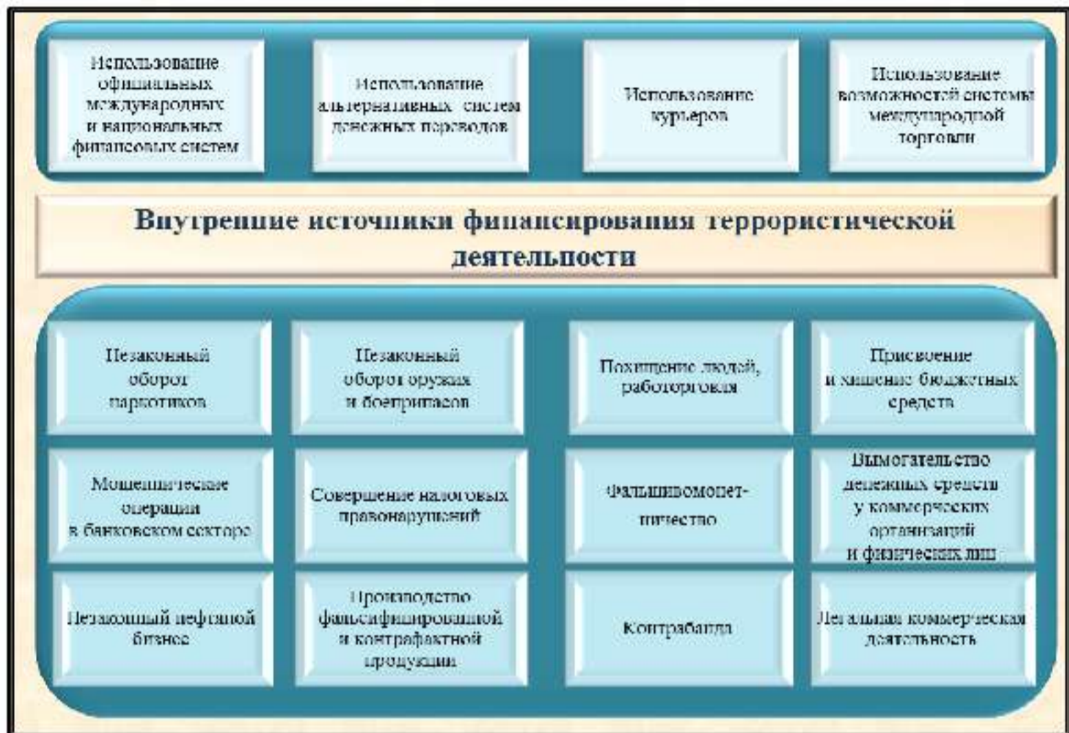
Рис.4. Основные методы и источники поступления финансовой помощи субъектам террористической деятельности на территории России

Кроме того, имеются примеры создания экстремистами и их пособниками легальных коммерческих структур, часть прибыли которых направляется на финансирование террористической деятельности.