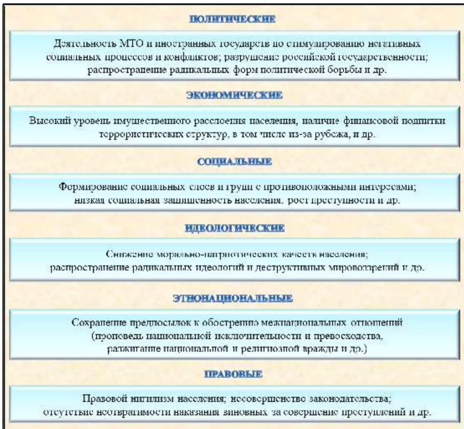
Рис 2. Факторы, способствующие сохранению террористических угроз в Российской Федерации

К правовым факторам относят низкую правовую грамотность населения, отдельных лидеров политических партий, организаций, движений, которая не позволяет адекватно оценить меру своей ответственности за совершаемые действия и их последствия; громоздкость процессуального законодательства; отсутствие эффекта своевременного и строгого наказания виновных за совершение преступных деяний и некоторые другие (рис. 2).