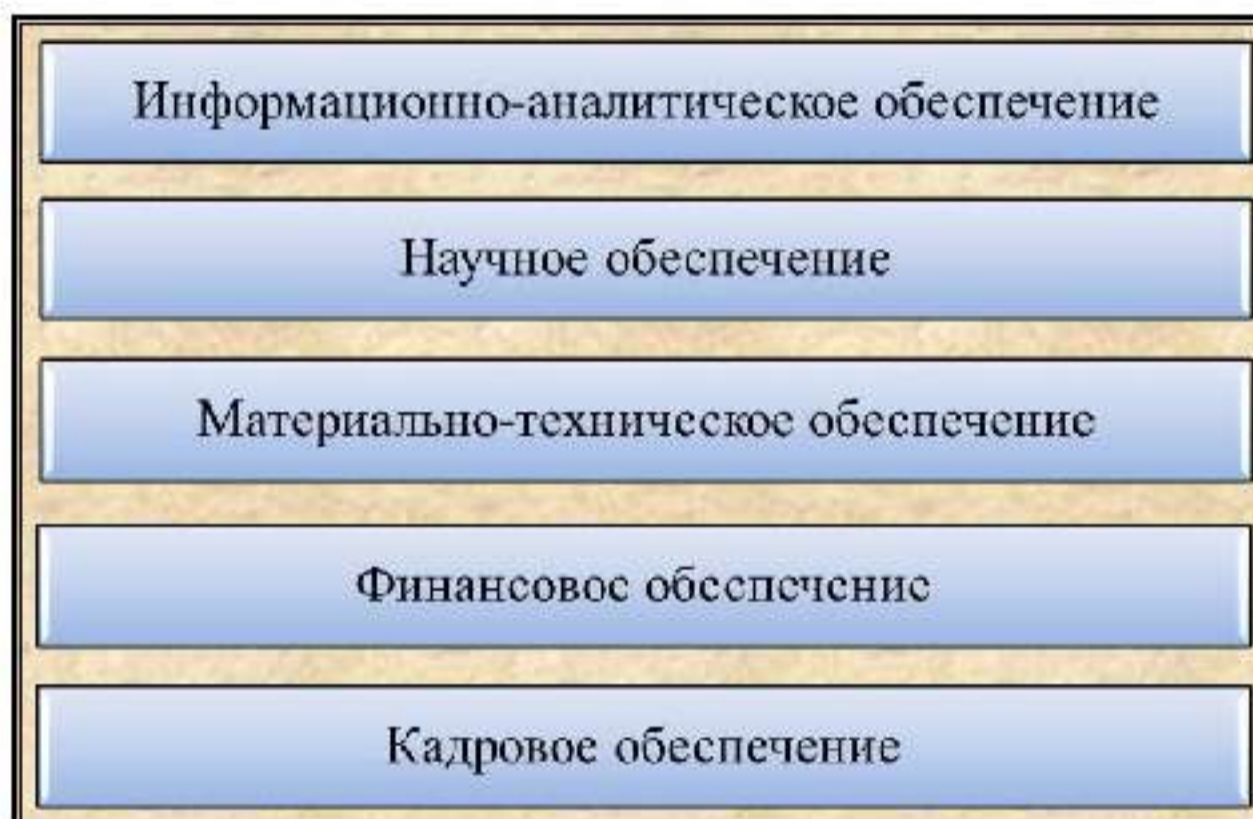
Рис. 7. Структура ресурсного обеспечения ОГСПТ

Эффективное решение задач по противодействию терроризму на общегосударственном уровне требует надлежащего ресурсного обеспечения деятельности ОГСПТ, в т. ч. информационно-аналитического, научного, материально-технического, финансового и кадрового (рис. 7).