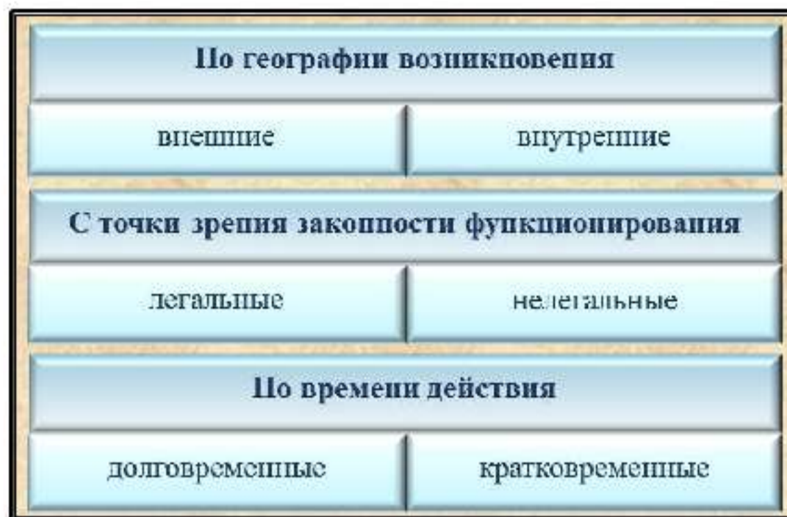
Рис.3. Классификация источников финансирования терроризма

Основными методами финансирования субъектов террористической деятельности на территории России являются: