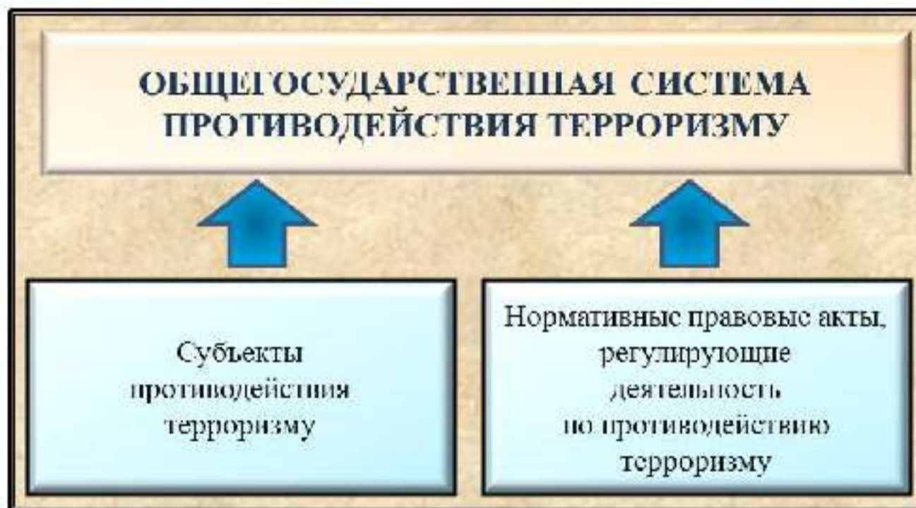
Рис. 5. Общегосударственная система противодействия терроризму

Согласно п. 5 Концепции противодействия терроризму в Российской Федерации (далее – Концепция) ОГСПТ представляет собой совокупность субъектов противодействия терроризму и нормативных правовых актов, регулирующих их деятельность по выявлению, предупреждению (профилактике), пресечению, раскрытию и расследованию террористической деятельности, минимизации и (или) ликвидации последствий проявлений терроризма (рис. 5).